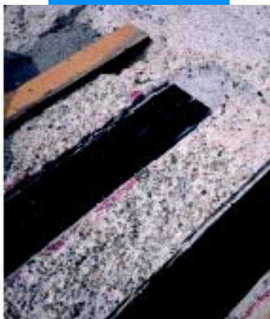
Фиксация пластин Carboplate в специально подготовленных выемках на поверхности

Вследствие повышенной клеящей способности составов Adesilex PG1 и Adesilex PG2 по металлу все использованные для нанесения клеящего вещества инструменты необходимо очистить растворителем (этиловым спиртом, толуолом и т.п.) до его высыхания.