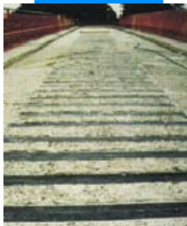
Мостовой настил, усиленный пластинами Carboplate