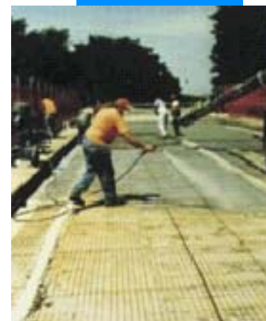
Наложение эпоксидной грунтовки