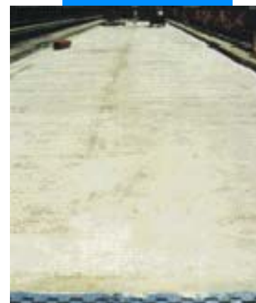
Вид восстановленного мостового настила