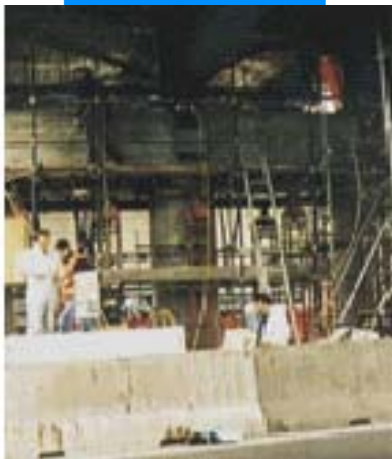
Вид моста во время ремонтных работ

строительстве без использования специальных машин и оборудования, экономит время и зачастую может накладываться на конструкцию без задержек в основном процессе строительства. В отличие от методики покрытия конструкций металлическими листами (плакирование бетона) процесс наложения пластин Carboplate не требует устройства временного усиления конструкции на период наложения, тем самым устраняя риск коррозионного повреждения накладываемых усиливающих конструкций. Пластины Carboplate быстро и легко устанавливаются на месте строительства. Благодаря их высокой гибкости пластины Carboplate пригодны для покрытия цилиндрических поверхностей структур (днищ бассейнов, резервуаров и т.п.) с радиусом кривизны более 3 м.